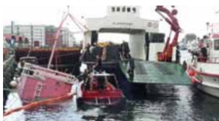
SANK: Den rosa Moods-båten.

Båten som har tilhørt Moods of Norway i fem år, ble hevet i går. Men det var ikke snakk om å reparere skadene, og båten ble tauet rett til opphogging. Like-